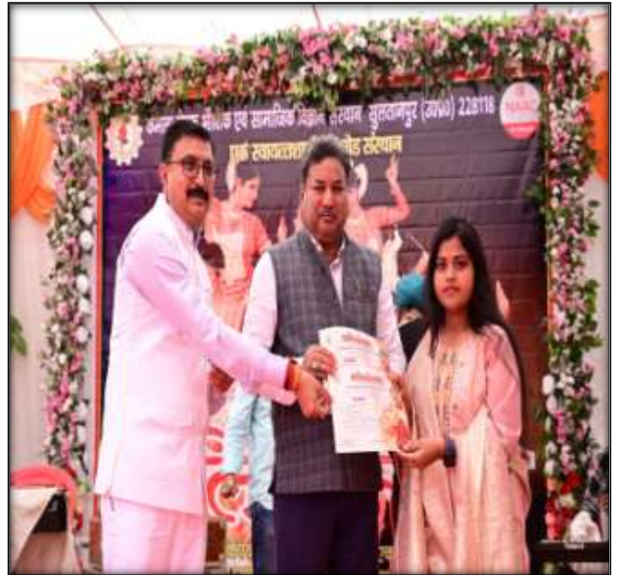
Certificate and Award Distribution